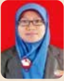
Nurul Hikmah LPK Al Hikmah TIK