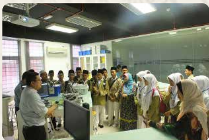
Siswa MA Al Hikmah 2 mendengarkan penjelasan tentang robotika di Fakultas Sains Komputer, Universiti Putra Malaysia