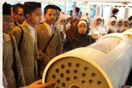
Siswa MA Al Hikmah 2 sedang mendengarkan penjelasan dalam Bahasa Inggris tentang proses daur ulang air di New Water Singapura