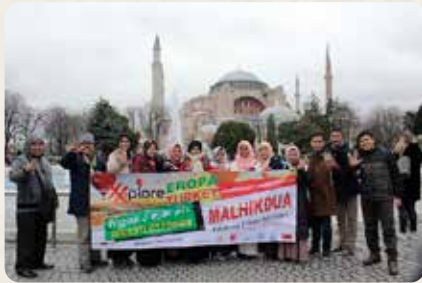
Hagia Shopia "Topkapi", tim Malhikdua ngaji sejarah kejayaan Turkiye Ottoman