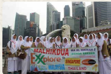
Rombongan Malhikdua Explore di depan patung Merlion, Singapura