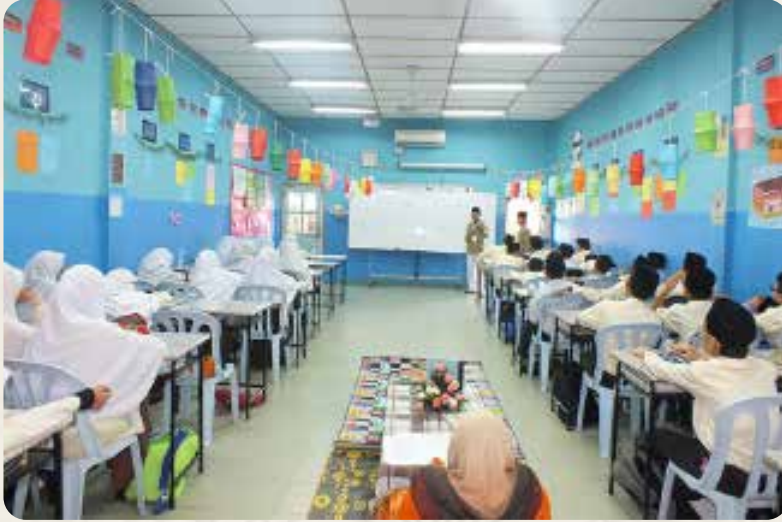
Siswa Teaching Program Malhikdua sedang praktik mengajar Bahasa Arab di Madrasah tingkat Rendah ABIM Malaysia

di Madrasah ABIM Malaysia (selama 2 minggu):