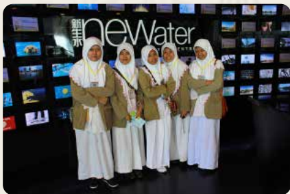
Siswa MA Al Hikmah 2 saat kunjungan ke New Water Singapura