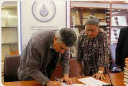
Penandatanganan kerjasama Malhikdua dengan Istanbul Ilim Ve Kultur Vakfi