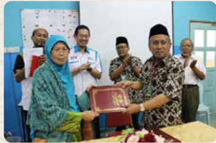
Penandatanganan MOU MA Al Hikmah 2 dengan Madrasah ABIM Malaysia