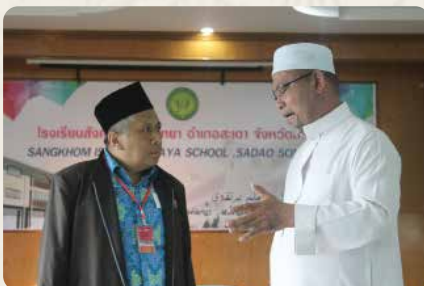
Kepala Malhikdua sedang berbincang dengan kepala sekolah saat kunjungan ke Thailand.