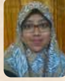
Elvy Laelatul Mubarakah LPK Al Hikmah Perikanan