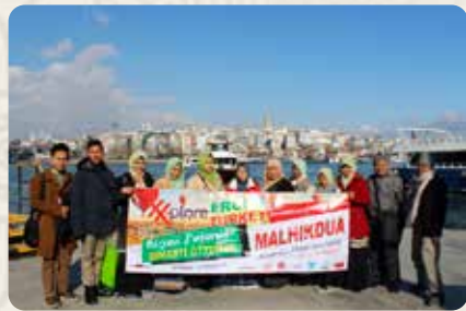
Selat Bosphorus (Menyelami semangat Al Fatih menaklukan dunia)