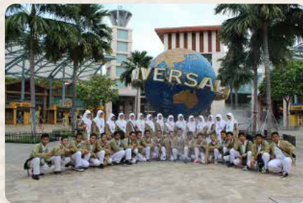
Rombongan Malhikdua Explore 2015 berfoto di Universal Studio Singapura