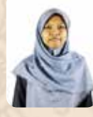
Nurohmah LPK Al Hikmah TIK