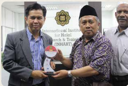
Kepala MA Al Hikmah 2 bersama dengan Direktur International Institute for Halal Research & Training di Malaysia