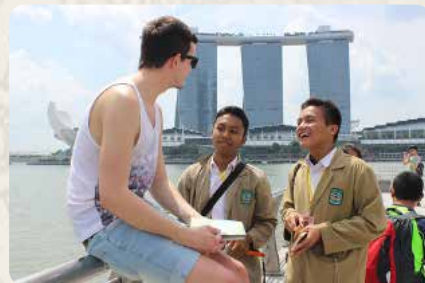
Siswa MA Alhikmah 2 berani berbicara Bahasa Inggris dengan turis di Merlion Park Singapura