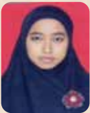
Jazilatun Ni'mah LPK Al Hikmah Tatabusana