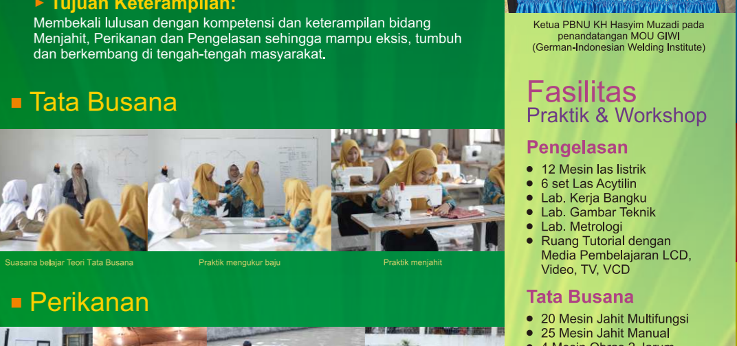
► Tujuan Keterampilan: Membekali lulusan dengan kompetensi dan keterampilan bidang Menjahit, Perikanan dan Pengelasan sehingga mampu eksis, tumbuh dan berkembang di tengah-tengah masyarakat. ■ Tata Busana Suasana belajar Teori Tata Busana Praktik mengukur baju Praktik menjahit