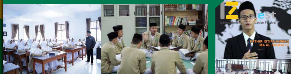
Belajar Bersama Pengajian Kitab Turats