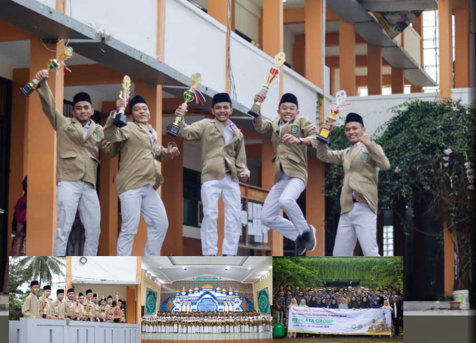
Foto bersama para juara | Halflah at Taudi | Mahasiswa baru AI Azhar alumni Malhiqdua