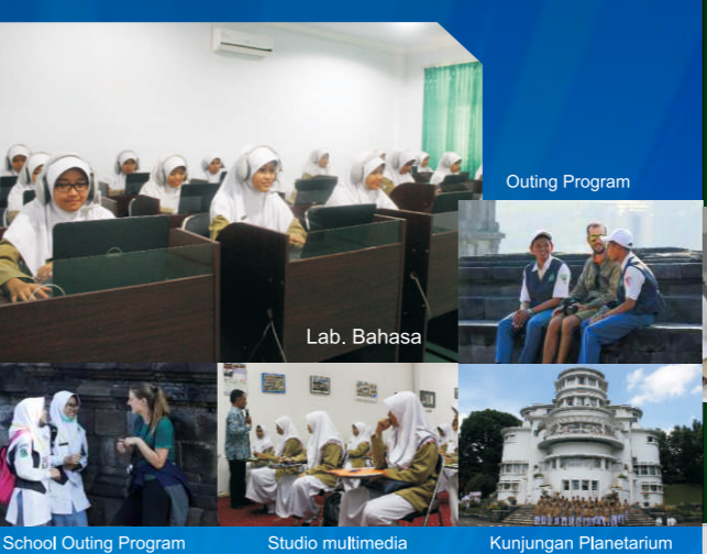
Outing Program Lab. Bahasa School Outing Program Studio multimedia Kunjungan Planetarium