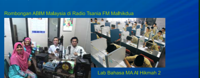
Rombongan ABIM Malaysia di Radio Tsania FM Malikhdua Lab Bahasa MA Al Hikmah 2