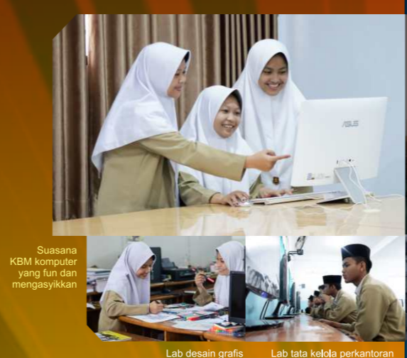
Suasana KBM komputer yang fun dan mengasyikkan Lab desain grafis Lab tata kelola perkantoran