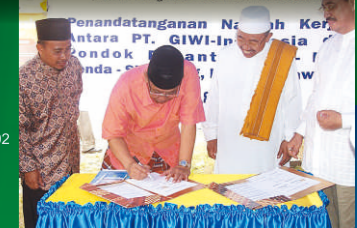
Ketua PBNU KH Hasyim Muzadi pada penandatanganan MOU GIWI (German-Indonesian Welding Institute)